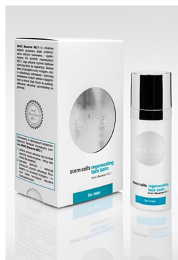
Rysunek 2. Prezentacja drugiej serii biodermokosmetyków REVITACELL.

Revitacell Stem Cells Regenerating Face Balm for Men - regeneracyjny balsam do twarzy dla mężczyzn na bazie opatentowanych komórek macierzystych MIC-1.